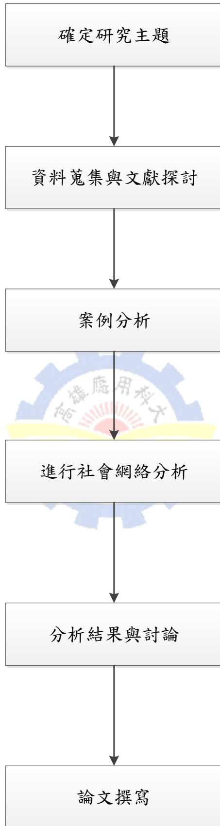
圖 1-2 研究流程